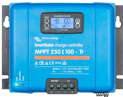
Solar-Laderegler MPPT 250/100-Tr mit einsteckbarem Display

Gleicht Konstant- und Ladeerhaltungsspannungen nach Temperatur aus.